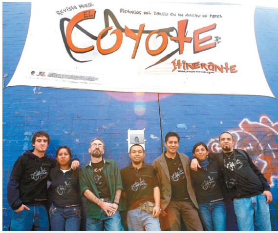
El futuro de la publicación está asegurado para los próximos dos números, pues obtuvieron el apoyo del GDF.

Sí, beneficiará a las parejas del mismo sexo, pero a otras muchas personas también; es una ley mucho más amplia que una ley homosexual.